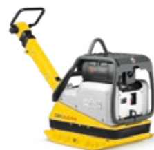
Mittelgroße reservierbare Vibrationsplatten ab EUR 299,-*