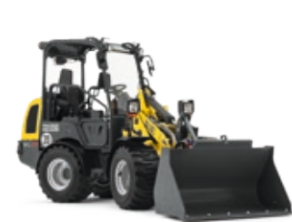
Radlader ab EUR 449,-*

Rabatt: ab 5 Maschinen 3% ab 8 Maschinen 5%