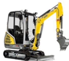
Bagger ab EUR 549,-*