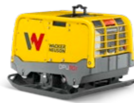
Große reversierbare Vibrationsplatte ab EUR 449,-*