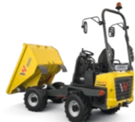
Dumper ab EUR 629,-*