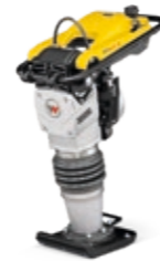
Stampfer ab EUR 279,-*