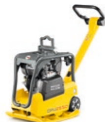
Kleine reservierbare Vibrationsplatten ab EUR 249,-*