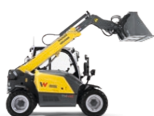
Teleskoplader ab EUR 499,-*