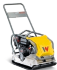
Vorwärtslaufende Vibrationsplatten ab EUR 279,-*