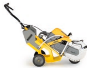
Trennschneider ab EUR 239,-*