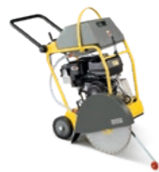
Fugenschneider ab EUR 329,-*