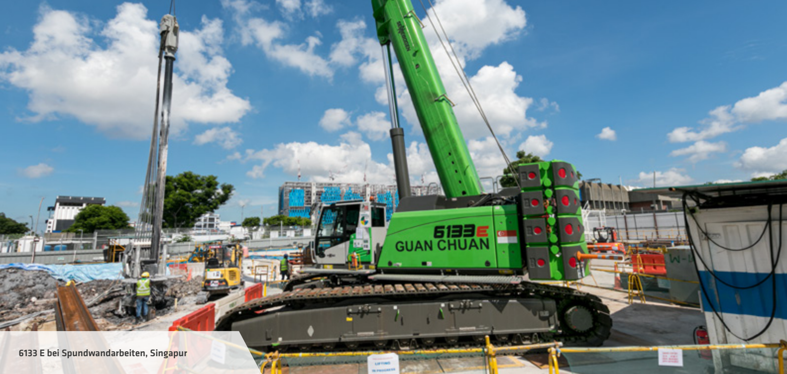
6133 E bei Spundwandaarbeiten, Singapur