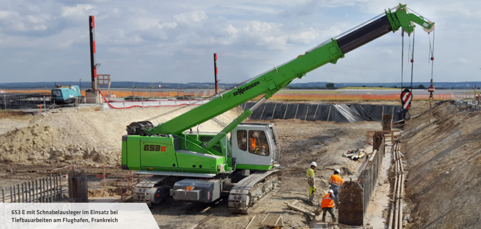
653 E mit Schnabelausleger im Einsatz bei Tiefbauarbeiten am Flughafen, Frankreich