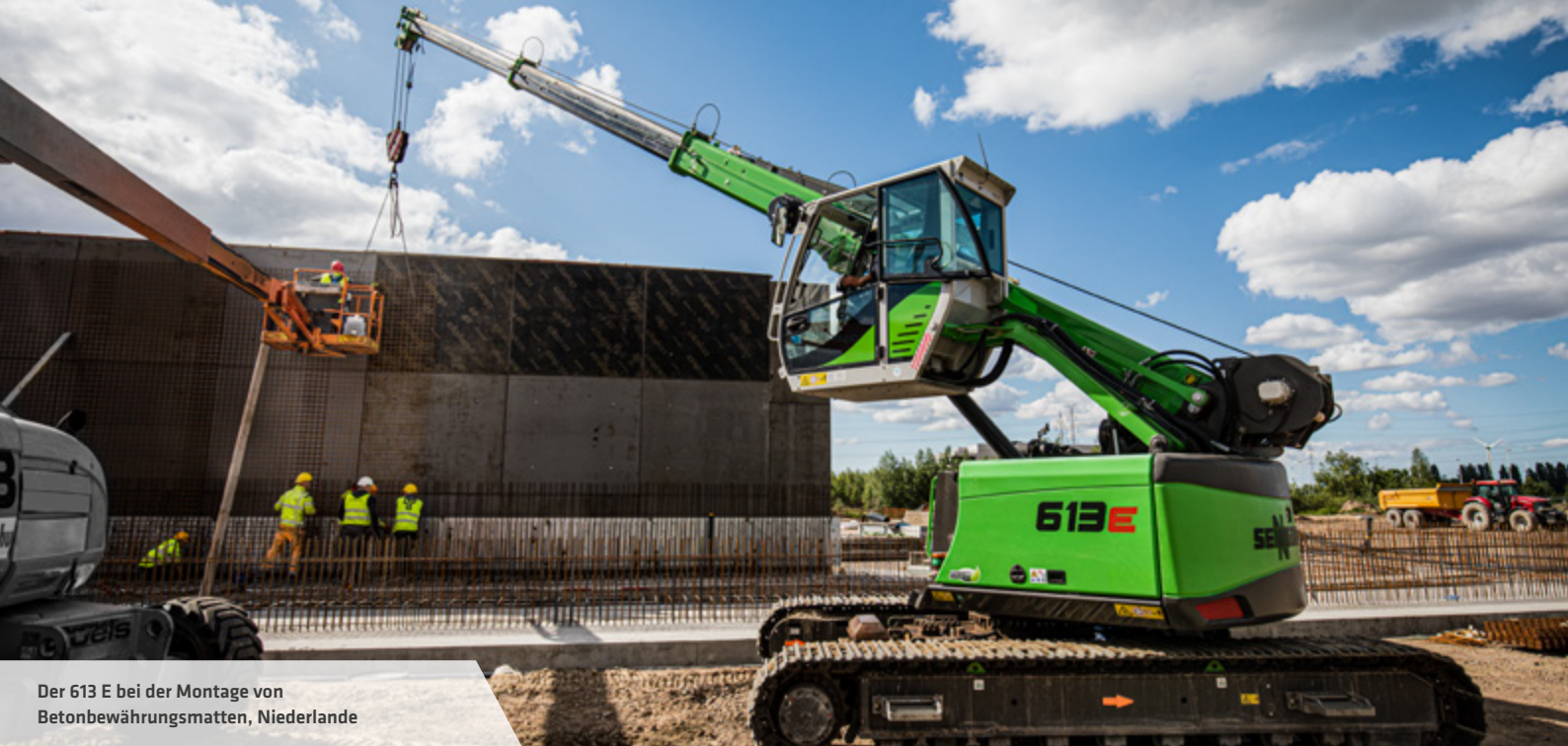
Der 613 E bei der Montage von Betonbewehrungsmatten, Niederlande