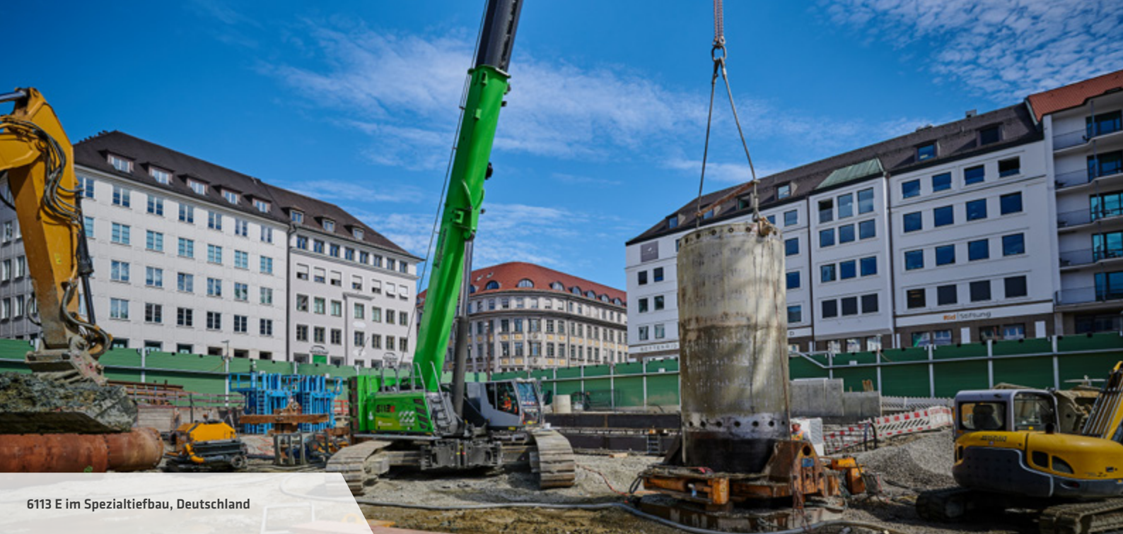
6113 E im Spezialtiefbau, Deutschland